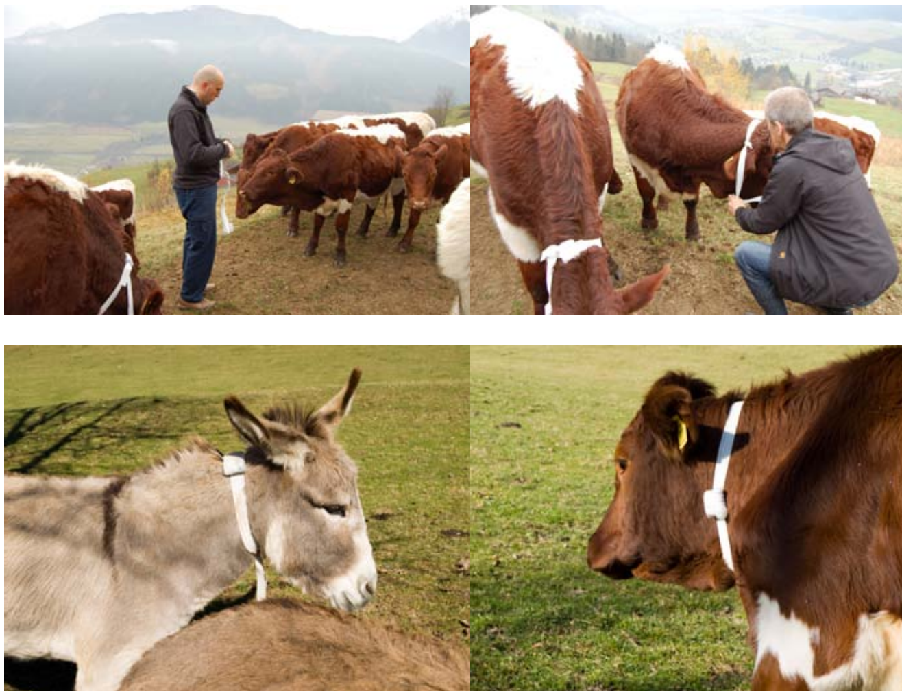
Fig. 3. - 6. - setup, attaching of GPS loggers

a location based installation by Gebhard Sengmüller for Hyperlink ( http://www.hyperlink.li ), Stuhlfelden 2008